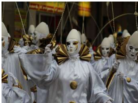
Les Copins 2_2019_© Denis Ducasse

Le carnaval, le plus long du monde, est un événement traditionnel et incontournable dont les origines remonteraient au 16ème siècle ! Pendant trois mois, tous les samedis et dimanches à 11h, 16h30 et 22h les bandes (Fecos) sortent à l'occasion de la journée qui leur est consacrée. Derrière la musique suivent les «Goudils» (personnes masquées), drôles, nobles ou plus ordinaires.