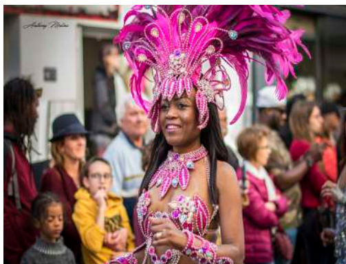
Brésil_Carnaval du Monde_2019 (10)