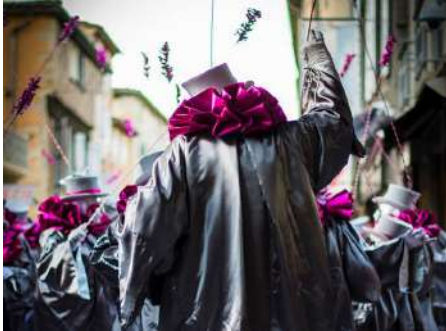
Les Infialurs d'Achille 1_2019_©Anthony Molina