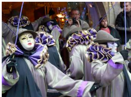
Les Copins 2_2019_@ Denis Ducasse

LIMOUX CARNAVAL DE LIMOUX 2024 : SORTIE « LE TIVOLI ». Voir détail page 7.