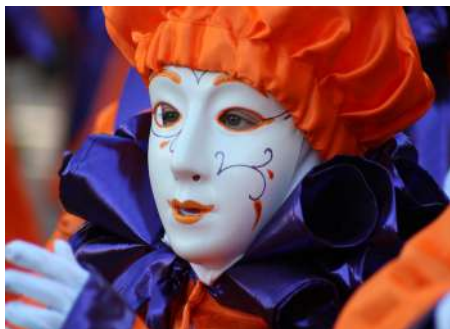
Les Drôles 1_2019_© Denis Ducasse