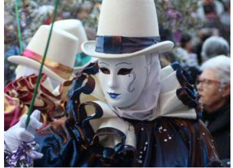
Les Anciens 1_2019_© Denis Ducasse

A l'occasion du Mardi Gras, c'est la bande « les Anciens », la plus ancienne des bandes créée en 1927, qui sort et qui anime la fête ! Elle est composée exclusivement d'hommes.