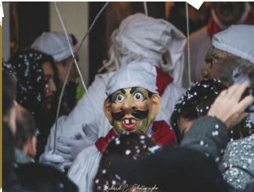
Les Meuniers_FMA_Carnaval de Limoux_2020-01-19_

Le carnaval le plus long du monde, est un évènement traditionnel et incontournable dont les origines remonteraient au 16ème siècle ! Pendant trois mois, tous les samedis et dimanches à 11h, 16h30 et 22h les bandes (Fecos) sortent à l'occasion de la journée qui leur est consacrée. Derrière la musique suivent les «Goudils» (personnes masquées), drôles, nobles ou plus ordinaires. Arrivée du Char sur la Place le samedi 6 janvier à 19h.